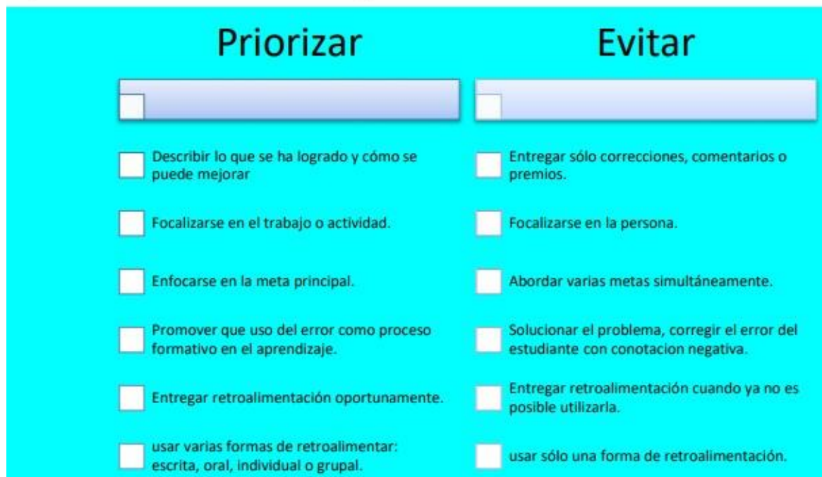
Esquema: Retroalimentación constante, proceso formativo 1